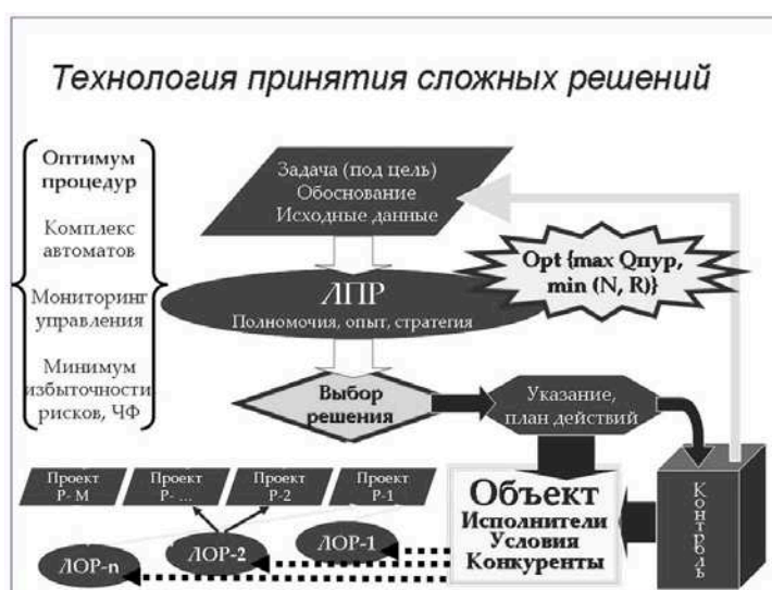
Рис. 5. Алгоритм и технология принятия сложных решений при управлении ЭТС

Тем самым многокритериальное и полимодельное сравнение альтернативных вариантов ЭТС, их ранжирование по вариантам построения и эксплуатации, прежде всего по результатам моделирования функционирования сложных ЭТС, позволяет обеспечить системное комплексное обоснование их развития , мониторинг системных показателей качества ЭТС с формированием соответствующих баз данных и знаний (БДЗ), динамики их наращивания, что имеет особо важное значение для сложных ЭТС.