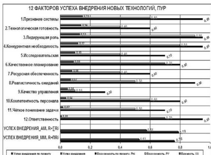
Рис. 4. Результаты полимодельного анализа качества ТСЗИ-АВЗ

Тем самым многокритериальное и полимодельное сравнение альтернативных вариантов ЭТС, их ранжирование по вариантам построения и эксплуатации, прежде всего по результатам моделирования функционирования сложных ЭТС, позволяет обеспечить системное комплексное обоснование их развития , мониторинг системных показателей качества ЭТС с формированием соответствующих баз данных и знаний (БДЗ), динамики их наращивания, что имеет особо важное значение для сложных ЭТС.