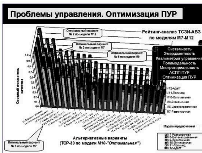
Рис. 3. Результаты полимодельного сравнительного анализа качества ТСЗИ-AB3

4. Использование концепции полимодельного анализа-синтеза ПУР, обеспечивающей многоаспектный (полимодельный) и комплексный учёт особенностей разработки и эксплуатации ЭТС с соответствующим многокритериальным методическим аппаратом и технологией автоматизированной поддержки принятия ПУР, например, с использованием систем класса АСППР типа «ASPID», «КРОПУР», «АСОР» [1, 2, 4].